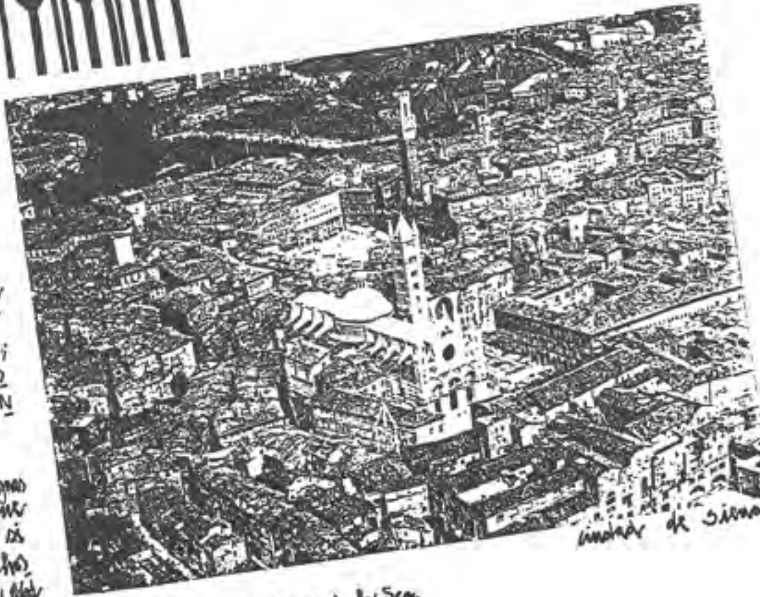
ciudad de Siena

• La relación que existe entre el Hospital y las murallas de la "ciudad alta" es la proximidad de ambos sitios desde el exterior; luego cualquier intervención allí deberá tener una señal distinta, por donde murallas, en la parte antigua, encontramos una densidad diferente.