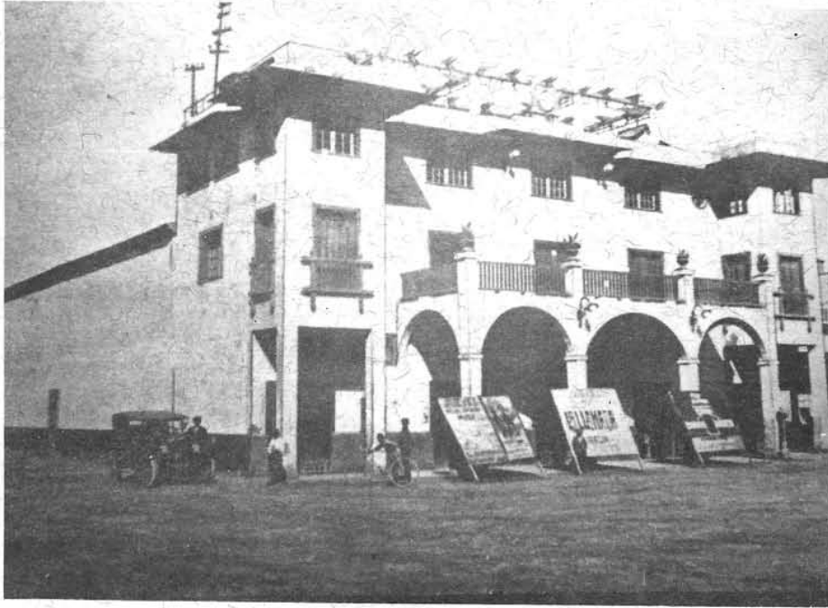
TEATRO CHACABUCO, 1940