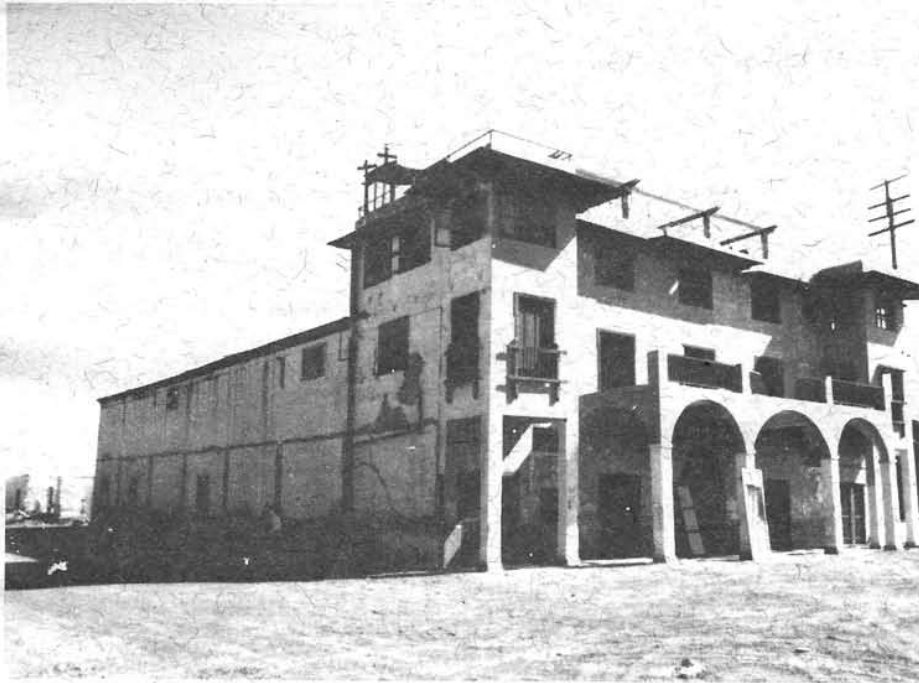
TEATRO CHACABUCO, 1992