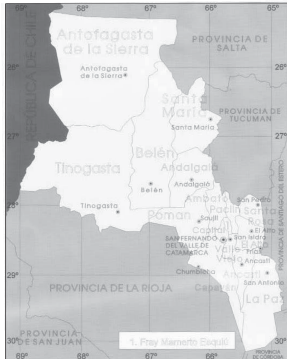
Figura 1. Mapa de la Provincia de Catamarca (Argentina).

río Belén se cultivan extensiones importantes de especies aromáticas para condimentos.