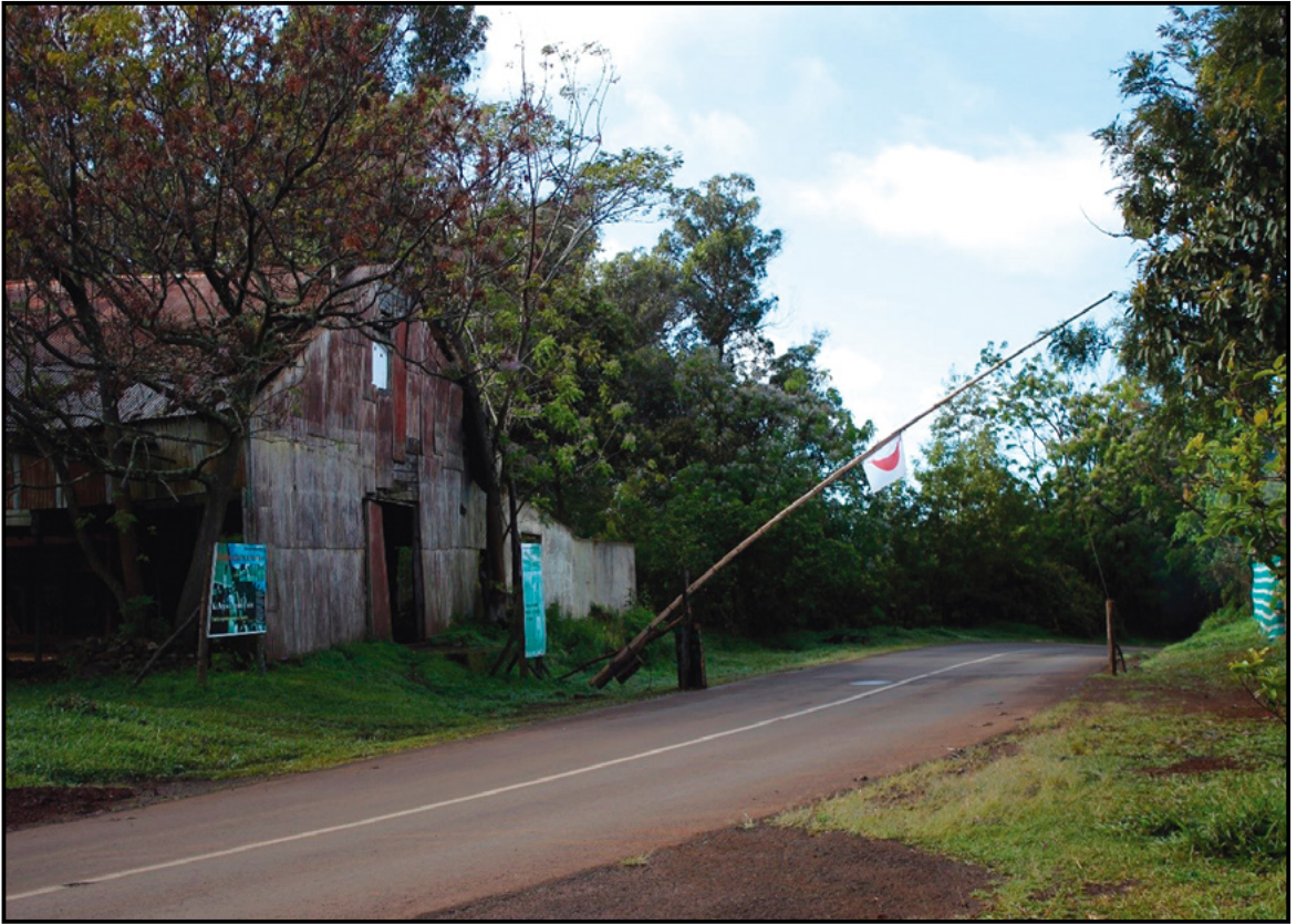
Figura 3. Patrimonio industrial de la Compañía Explotadora de Isla de Pascua en Vaitea, convertido en punto de control durante la toma del Parque Nacional Rapa Nui.

La lentitud del gobierno frente al tema prioritario de la agenda —control migratorio—, que se sumaba a la renuencia de CONAF para acoger la propuesta Ma'u Henua, derivó en que las autoridades rapanui consideraran la mesa quebrada, lo cual fue comunicado inmediatamente a la población de la isla. Como consecuencia, el día 26 de marzo de 2015 el Parlamento Rapa Nui efectuó la toma del parque a través del despliegue de puntos de control en los principales accesos (Figura 3), inhabilitando a la CONAF en su función de administrar el parque y cobrar entradas.