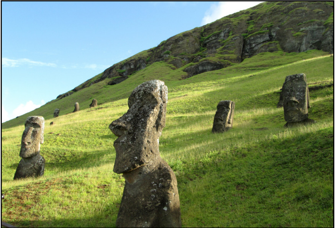
Figura 2. Sitio Ranu Raraku, cantera de los moái, dentro del Parque Nacional Rapa Nui. Fuente: Roberto Concha Mathiesen, marzo de 2014.