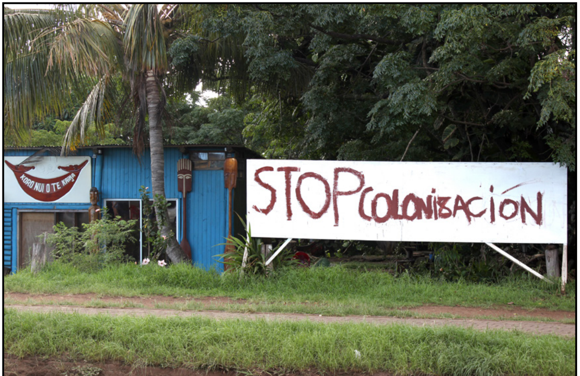
Figura 4. Letrero instalado afuera de la oficina del Centro Koro Nui o Te Kaiŷa, alusivo a la demanda de descolonización.

Tanto Hōnui como la comunidad Ma'u Henua son organizaciones autónomas representativas de toda