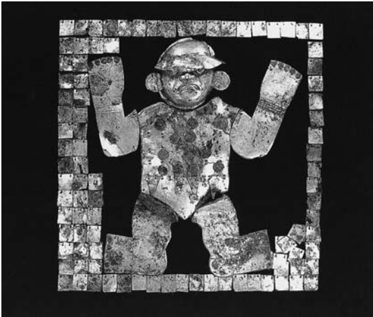
Figura 8. "Estandarte" de T.3 (para ubicación ver Figura 7, 26). (Tomado de Alva 1998, lámina 287).