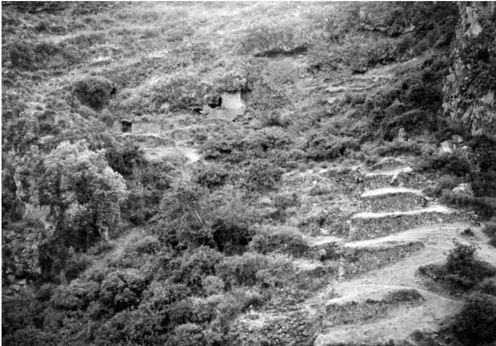
Figura 3. Pisac. Area funeraria con andenes encima del margen derecho del río Kitamayu (para ubicación ver Figura 2).