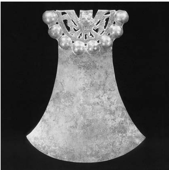
Figura 9. Protector coxal de T.3 (para ubicación ver Figura 7, debajo de 7, 40-42). (Tomado de Alva 1998, lámina 269).

finalmente, a su conversión en dios o ancestro divinizado, apoyado por dioses como el "Degollador" y quizá el "Dios de los Ulluchos". En esta nueva identidad inicia su viaje por un ambiente acuático. Con armas y tocados cambiantes se enfrenta a adversarios como el felino y el cangrejo antropomorfizados, proceso en el cual otra vez recibe ayuda de otros seres.