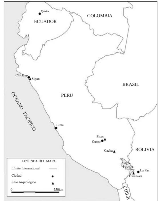
Figura 1. Mapa con los sitios mencionados en el texto.

En cuanto a lo preincaico conviene primero indagar sobre la relación entre los incas y Tiwanaku, el centro del mundo y el lugar de origen por excelencia. En sus primeros dos capítulos Betanzos recoge mitos locales –aparentemente no versiones “oficiales”– acerca de seres míticos llamados viracochas y los vincula con ancestros petrifica-