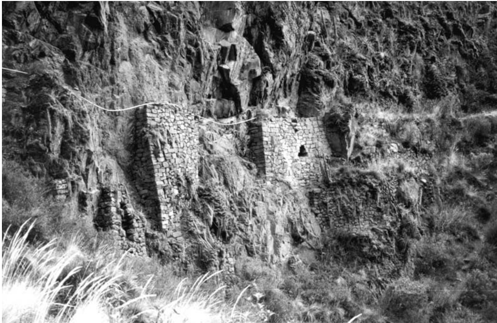
Figura 5. Pisac. Acueducto 2 (para ubicación ver Figura 2).