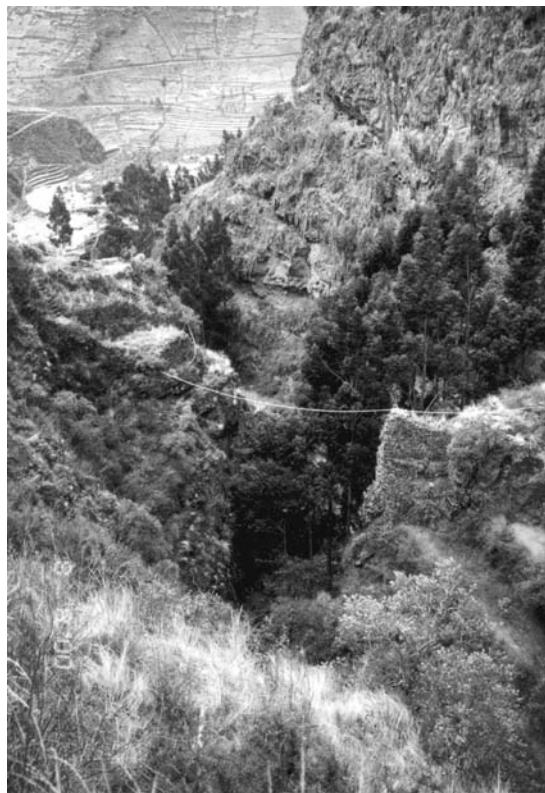
Figura 4. Pisac. Acueducto 1 (Antachaca) visto desde el norte (para ubicación ver Figura 2). (Foto T. Kusuda).