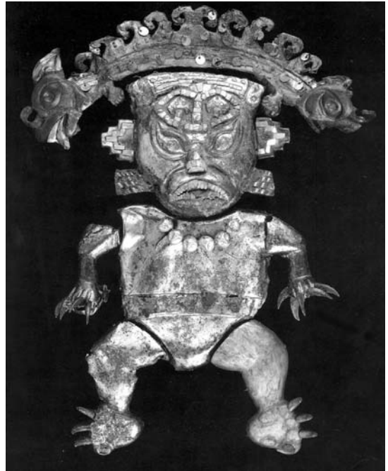
Figura 10. Felino antropomorfo de T.3 (para ubicación ver Figura 7, 9-28). (Tomado de Alva 1994, lámina 173).