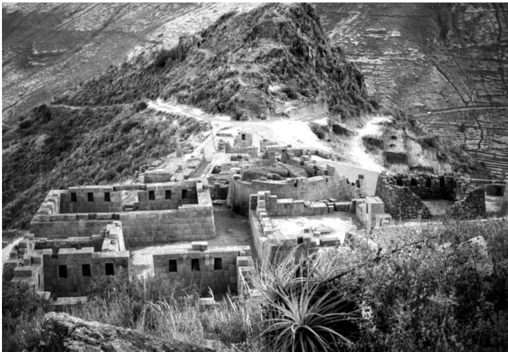
Figura 6. Pisac. Sector Intihuatana visto desde Inka Qonqorina (para ubicación ver Figura 2).