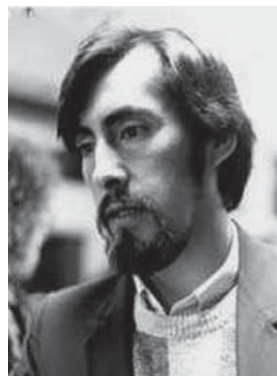
Figura 1. Elicura Chihuailaf.

Elicura Chihuailaf viene desarrollando una intensa producción escrita desde inicios de la década de los '80, y se ha convertido en uno de los poetas mapuche más conocidos en Chile y en el extranjero (Figura 1). La poesía de Chihuailaf ha sido definida por críticos y especialistas en el tema como “poesía etnocultural”, aquella en que el dis-