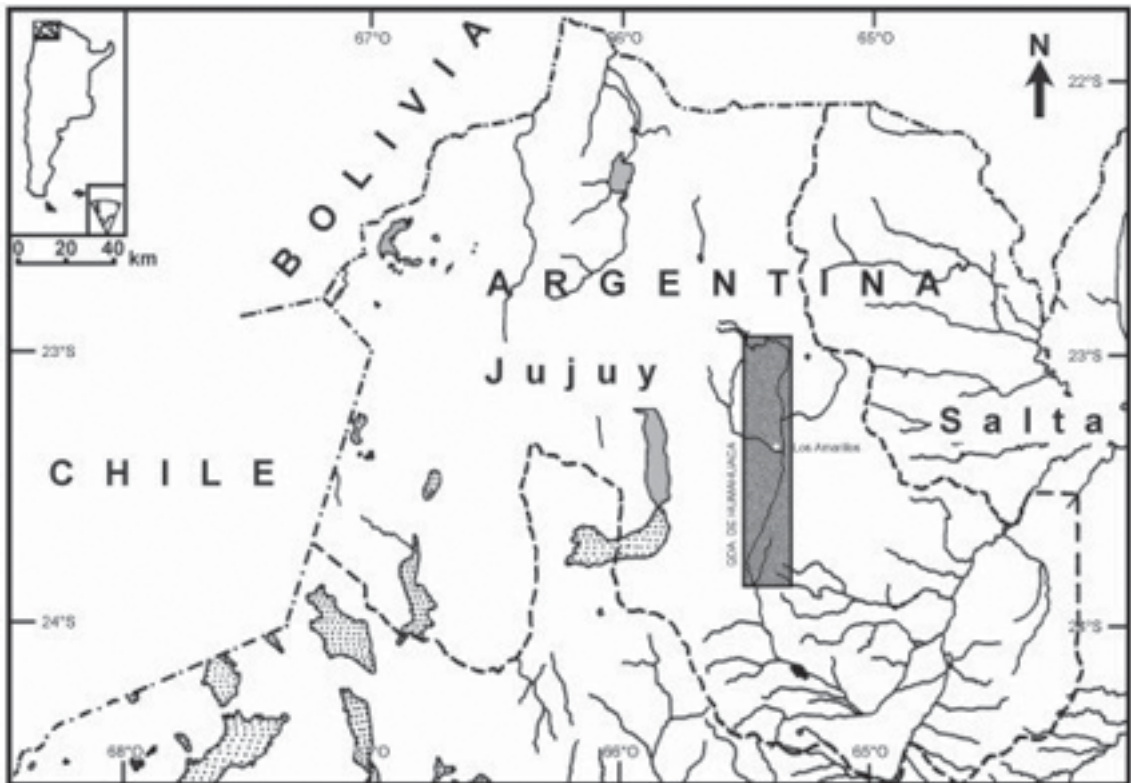
Figura 1. Ubicación de la quebrada de Humahuaca en Argentina.

Para caracterizar el modo de vida de los pueblos prehispánicos de la quebrada de Humahuaca, se