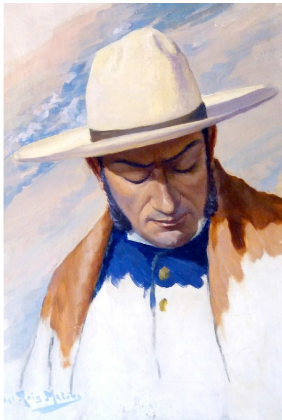
Figura 2. Fidel Roig Matons. Estudio de Expresión (óleo sobre hardboard, 40 x 54 cm). Pinacoteca del Concejo Deliberante de la Ciudad de Mendoza.

sobre el tema. Igual que los balandranes y los ponchos, los colores más frecuentes de las mantas eran el azul (18 casos) y el blanco (ocho casos). Estos representaban cerca del 75% del total. La novedad se encuentra en el ascenso del color negro (cuatro casos) que se desprendía de los demás colores, y se ubicaba como el tercero más recurrente entre las mantas regionales. En menor medida aparecían mantas de color negro (cuatro casos), colorado, verde y carey.