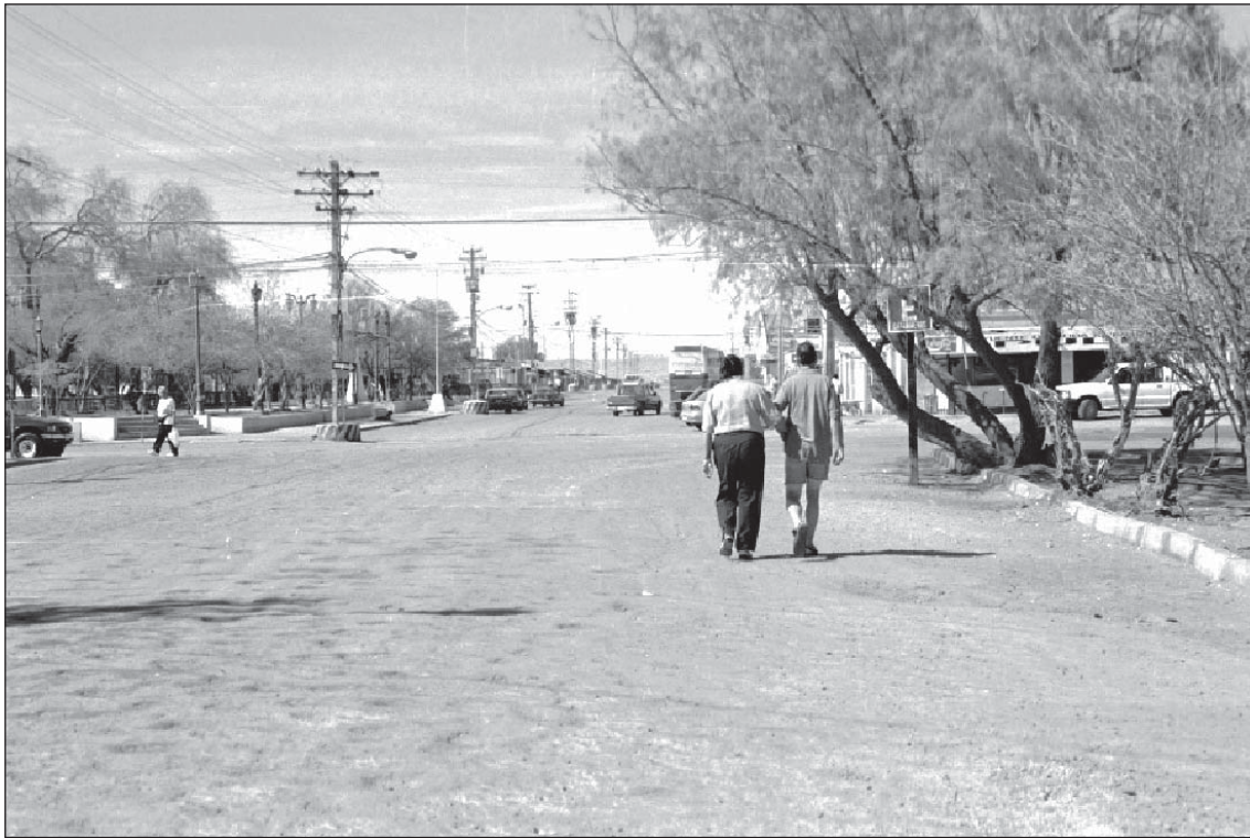
Figura 2. Vista general de una de las calles conducentes a la plaza de María Elena.

la Oficina Pedro de Valdivia (1996) y todos los otros pueblos y oficinas en el pasado, realizan como ejercicio de memoria una lectura redentora, a veces paradisíaca y desiderativa, más que trágica del mundo del salitre (Figura 2).