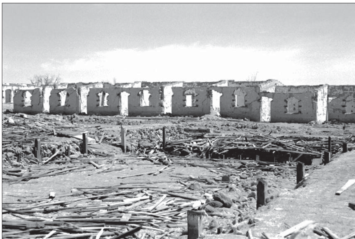
Figura 4. Estado actual de la Oficina Salitrera Vergara.

dos privativos de esta Oficina. Así, resaltan duendes traviosos y juguetones que alteran la vida de las familias; un hombre de más de dos metros, que a pesar de haber sido enterrado en el cementerio hace muchos años, sigue creciendo varios centímetros al año; otro, que le ha pedido a un taxista que lo lleve al campo santo, y una vez que el conductor se vuelve a cobrar el importe, el pasajero misteriosamente desaparece, para ser visto con su terno café cerrando la puerta desde el interior del cementerio. No es extraño, también, escuchar de misteriosas huellas de 50 o 60 cm, las que son atribuidas a seres extraterrestres, y al mismísimo diablo, el que a veces llega confundido en un remolino, o se aparece al interior de los hogares.