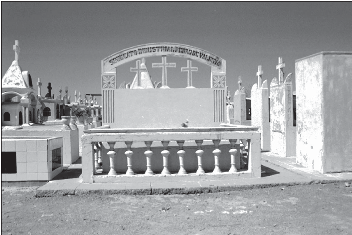
Figura 5. Cementerio de Vergara: Tumbas de los dirigentes sindicales caídos tras la huelga de 1956.

Mira con desdén sobre las tumbas, y suelta sus emociones: