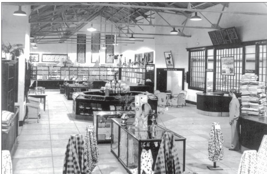
Figura 3. Vista interior de la sala de telas de la antigua pulpería de María Elena.

“Los de María Elena son casi todos de la cuarta región. En cambio, los de Pedro de Valdivia son de Santiago al sur”.