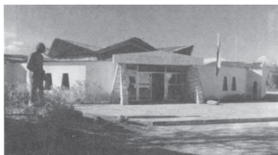
Figura 2. Museo Arqueológico de San Pedro de Atacama.

Con el objeto de colaborar con científicos visitantes y perfeccionar su propio Programa, el Instituto establece convenios de mutuo beneficio en los siguientes casos: