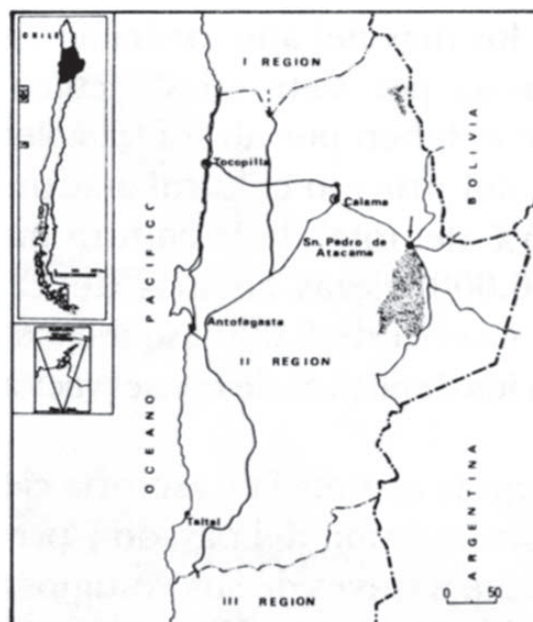
Figura 1. Ubicación de San Pedro de Atacama en la II Región.

Se localiza en el pueblo de San Pedro de Atacama a 2360 m.snm entre notables tradiciones indígenas e hispanas, distante a 100 km de Calama y 370 km de Antofagasta, las ciudades más próximas (Figura 1).