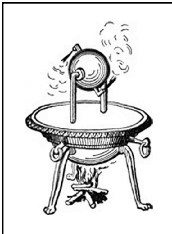
Figura 1. Estructura del primer dron.

Es obvio que el diseño y estructura del primer dron (Figura 1) dista mucho de los actuales, pero su función era la misma y sus utilidades en el campo militar muy parecidas a las actuales. A modo de dato histórico-militar, existe una hipótesis que ubicaría la aparición del primer dron en el año 350 AC de la mano del matemático Arquitas de Tarento y que tendría la siguiente forma: