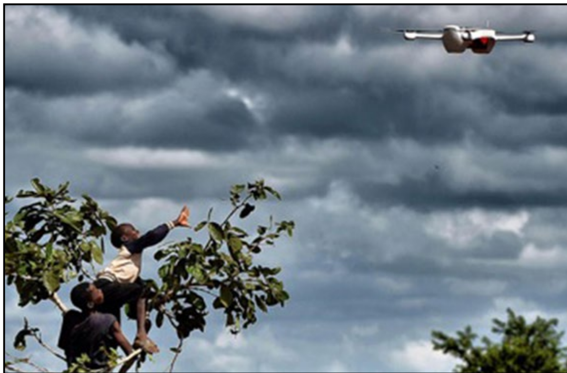
Figura 4. Proyecto de recogida de muestras con drones de HIV en Malawi.

saber, contar con “drones que serán más pequeños, baratos, y capaces de desarrollar tareas de manera totalmente autónoma”. La novedad reside en que este tipo de drones de segunda generación no requieren supervisión humana constante, contando con autonomía para modificar la trayectoria con el objetivo final y cumplir con su misión. Así, esta tecnología posibilita, como ya lo hemos señalado, acciones y sistemas basados en la inteligencia artificial, a la par que el desarrollo de redes multidrones. 4